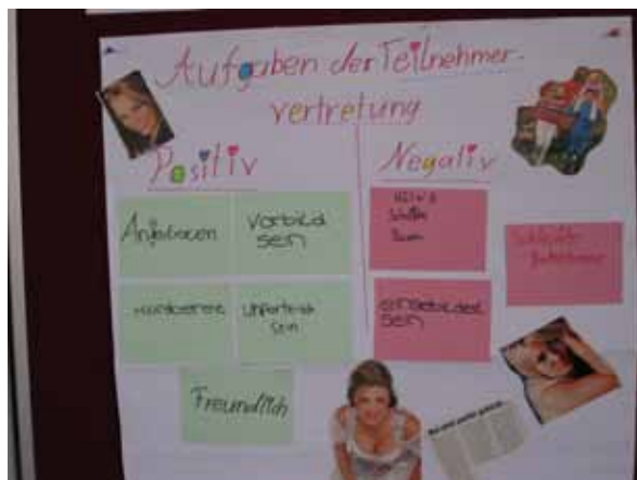
Foto sein. „Schwangerschafts- und Sexualberatung“: Das war unsere zweite Fortbildung. Wir wurden über alle Verhütungsmittel aufgeklärt, durften

„Dr. Sommer“ spielen und uns wurden alle Fragen die wir hatten beantwortet. Wir fanden unsere Fortbildungen interessant, informationsreich und hatten viel Freude dabei.“